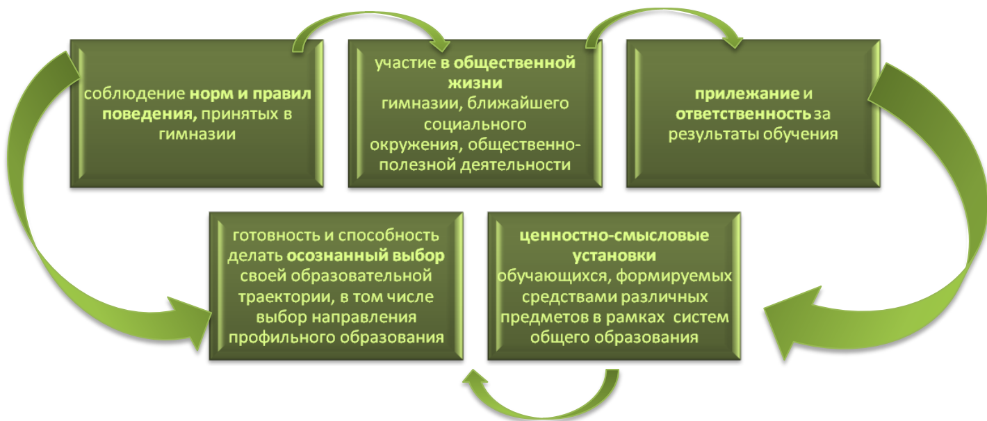
Рис.1 Показатели оценки личностных результатов

Внутришкольный мониторинг организуется администрацией НМБОУ «Гимназия №11» и осуществляется классным руководителем преимущественно на основе ежедневных наблюдений в ходе учебных занятий и внеурочной деятельности, которые обобщаются в конце учебного года и представляются в виде характеристики по форме, установленной НМБОУ «Гимназия №11». Любое использование данных, полученных в ходе мониторинговых исследований, возможно только в соответствии с Федеральным законом от 17.07.2006 №152-ФЗ «О персональных данных».