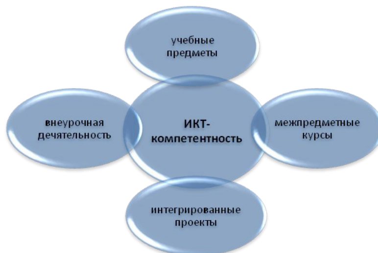
Рис. 2 Формы деятельности по формированию ИКТ-компетентности

По отношению к процессу формирования ИКТ-компетентности уроки информатики рассматриваются как средство стартового освоения средств ИКТ для последующего применения их в учебном процессе. Кроме того, уроки информатики помогут школьникам перевести стихийно складывавшиеся умения применения средств ИКТ на более высокий уровень.