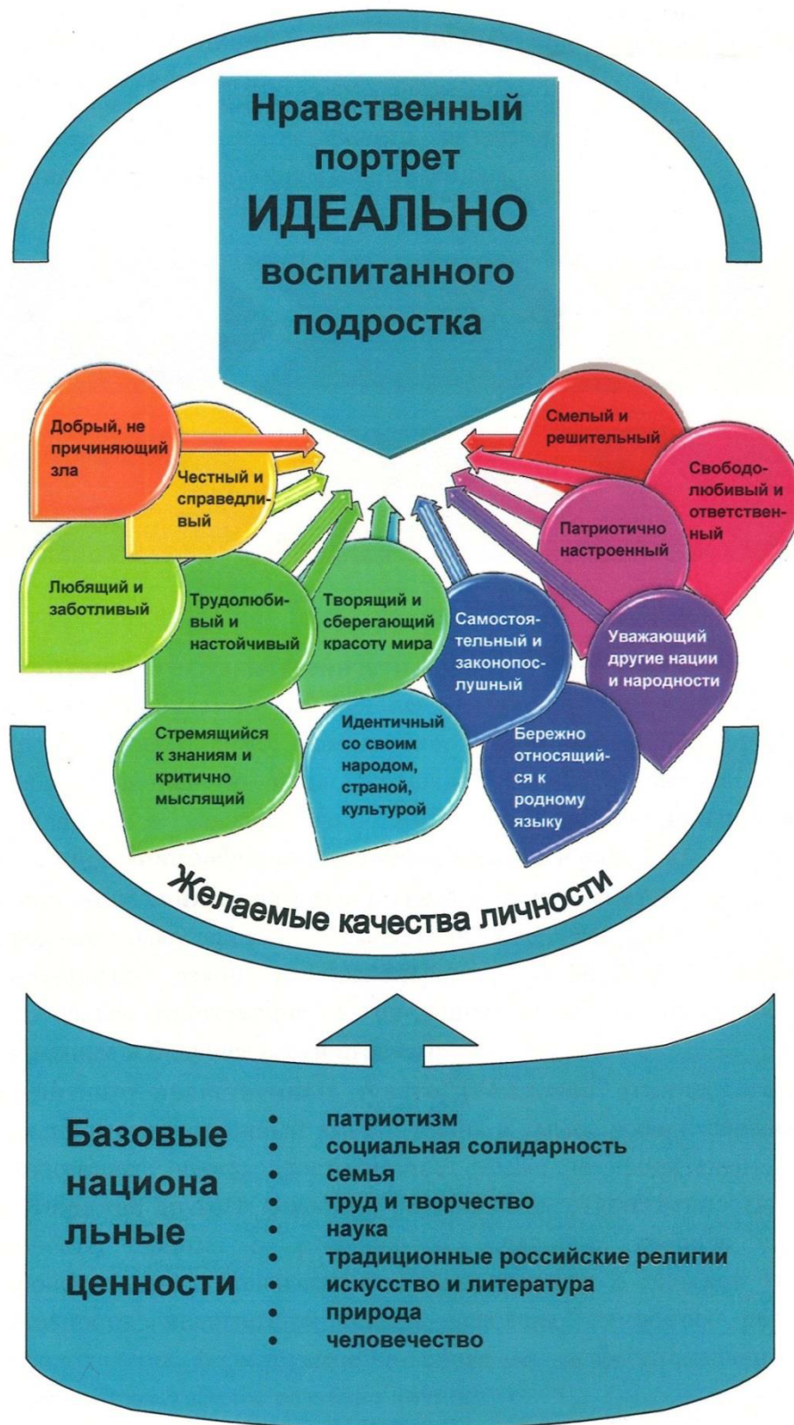
Рис. 3 Нравственный портрет воспитанного обучающегося